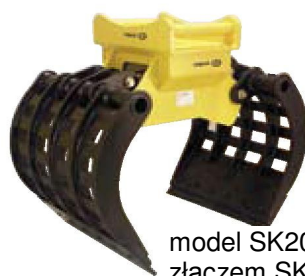
model SK20 ze złączem SK70