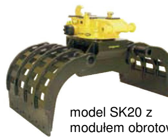
model SK20 z modułem obrotowym