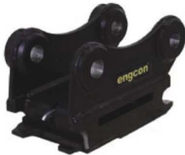
Model S30 otwierany mechanicznie, zatrask automatyczny.